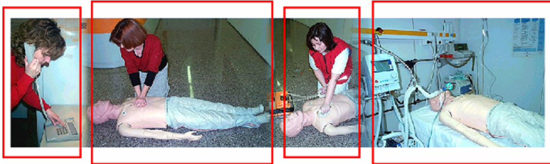
Activación Precoz SEM

La eficacia de la cadena de la supervivencia depende de la anilla más débil.