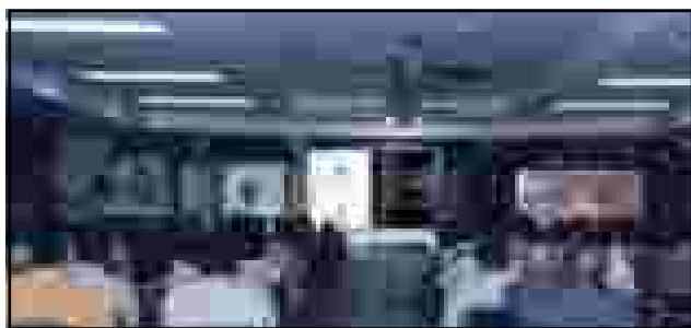
Evento de Santiago, Panamá

Una imagen radiológica puede orientar al médico en un diagnóstico, pronóstico o actitud terapéutica. Sin embargo, no hay que olvidar las limitaciones existentes en la obtención de la información debido a estructuras anatómicas próximas y que presentan una densidad radiológica similar.